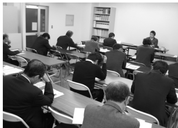
～ 成年後見制度研修会 ～