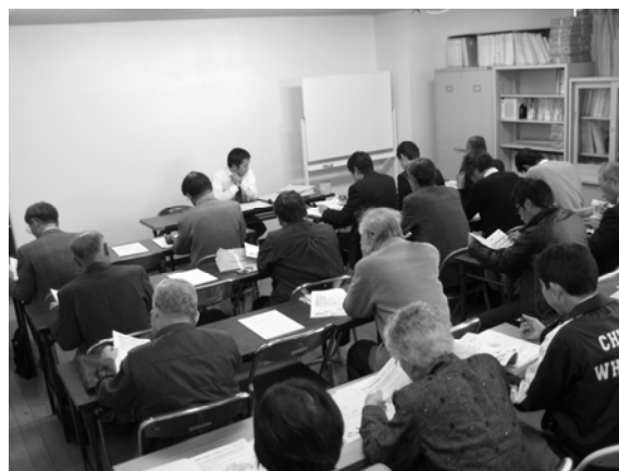
～ 新公益法人制度に関する説明会 ～