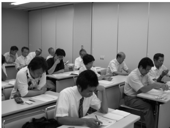
～ 新入会員研修会 ～