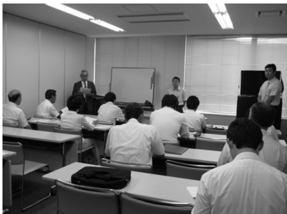
～ 新入会員研修会 ～